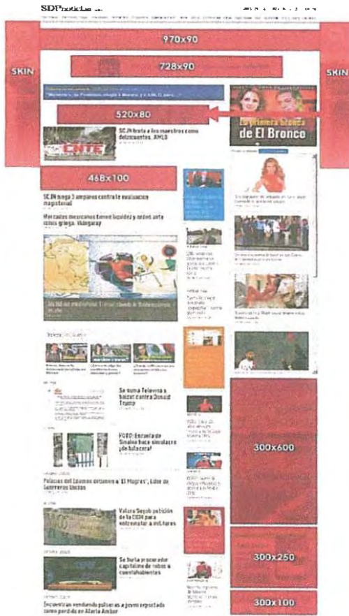
DIAGRAMA DE VISTA DE BANNERS EN SITIO:

Por este medio le hacemos llegar a su consideración, la siguiente cotización, ejercicio 2017 para campaña "CRÉDITO FONACOT, VERSIÓN: CRÉDITOS CON DESCUENTOS VÍA NÓMINA" en SDPNoticias, de acuerdo a lo que se detalla a continuación.