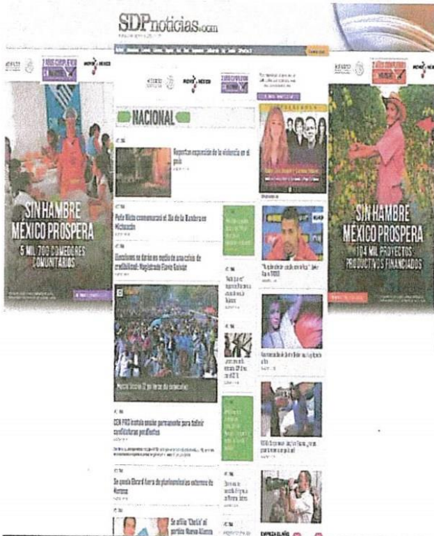
DIAGRAMA DE VISTA DE BANNERS EN SITIO:

SKIN Tamaño máximo: 300kb FIJO Banner FIJO 31 días Ubicación: Nacional y Columnas Periodo de la Campaña: 01 al 31 de diciembre de 2016 Vigencia de la Cotización: Hasta el 31 de diciembre de 2016