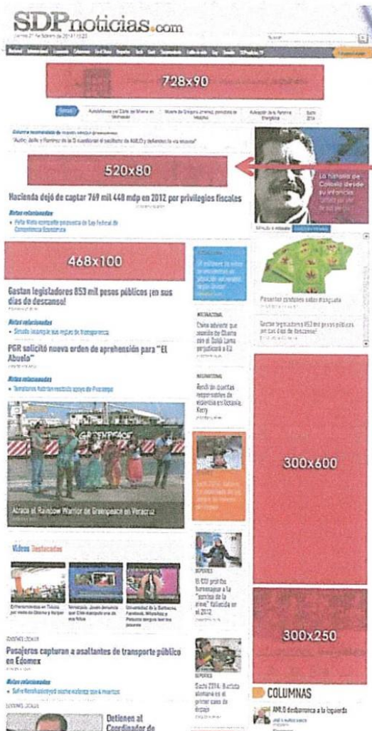
DIAGRAMA DE VISTA DE BANNERS EN SITIO:

BANNER 520 X 800 en modalidad costo por CPM: