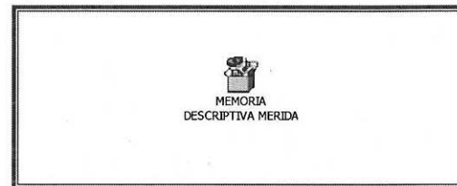
MEMORIA DESCRIPTIVA MERIDA

MEMORIA DESCRIPTIVA, ESPECIFICACIONES GENERALES Y PARTICULARES PARA LOS TRABAJOS