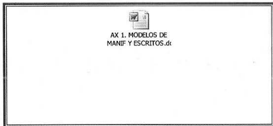
AX 1. MODELOS DE MANIF Y ESCRITOS.doc

MODELO DE ESCRITOS Y MANIFIESTOS EJEMPLIFICANDO LOS DATOS REQUERIDOS POR EL INSTITUTO FONACOT