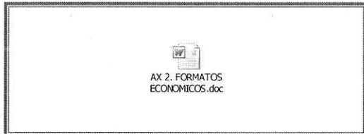
AX 2. FORMATOS ECONOMICOS.doc

FORMATOS EJEMPLIFICANDO LOS ANÁLISIS Y PROGRAMAS REQUERIDOS POR EL INSTITUTO FONACOT