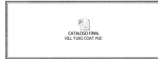
CATALOGO FINAL VILL TUXG COAT PUE