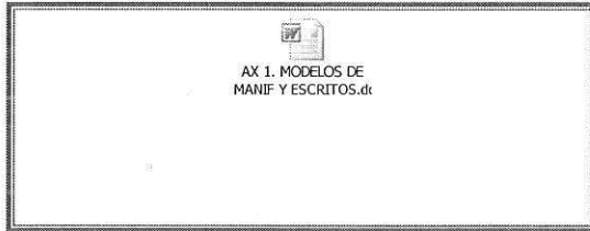
AX 1. MODELOS DE MANIF Y ESCRITOS.dti

MODELO DE ESCRITOS Y MANIFIESTOS EJEMPLIFICANDO LOS DATOS REQUERIDOS POR EL INSTITUTO FONACOT