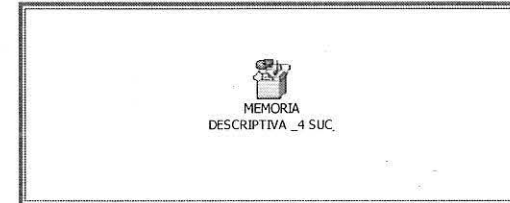
MEMORIA DESCRIPTIVA _4 SUC

MEMORIA DESCRIPTIVA. ESPECIFICACIONES GENERALES Y PARTICULARES PARA LOS TRABAJOS